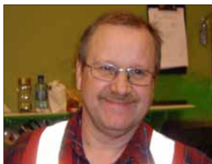
Mini Grorud, container-avdelinga MiTrans:

- Jeg mener at vi ikke kan gå tilbake til en ordning som er dårligere enn den som har vært, det ville være unaturlig for et rikt land som Norge.