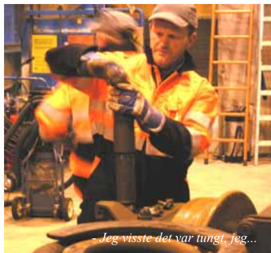
- Jeg visste det var tungt, jeg...

Ja, en fin ettermiddag, og for noen trivelige gutter! Men noe annet hadde jo overraska meg, sier