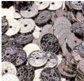
I årets lønnsoppgjør er vi ikke ute etter småpenger...

I MiTrans har også dyktige folk forsvunnet. I sammenlignbare oppgaver andre steder gis det langt romsligere lønningssporer, og folk blir lokket over. Klarer vi ikke å stoppe dette, tappes bedriftene for viktige arbeidsoppdrag fordi vi ikke er i stand til å utføre dem.